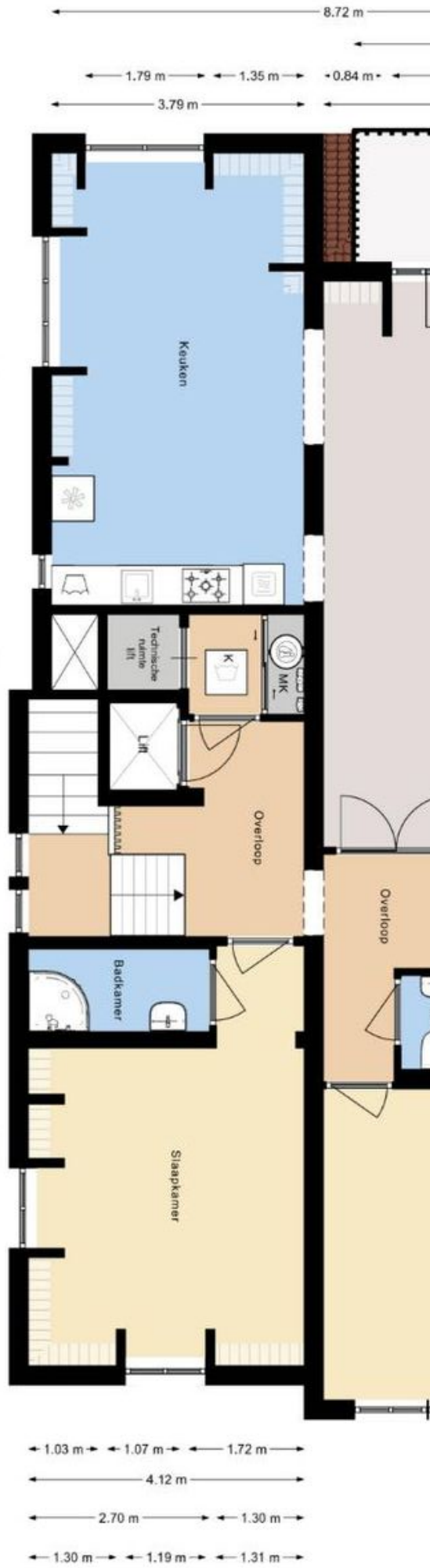
SCHIEVENINGSEWEG 110C | 3e Verdieping | Hoogte 2.68m |