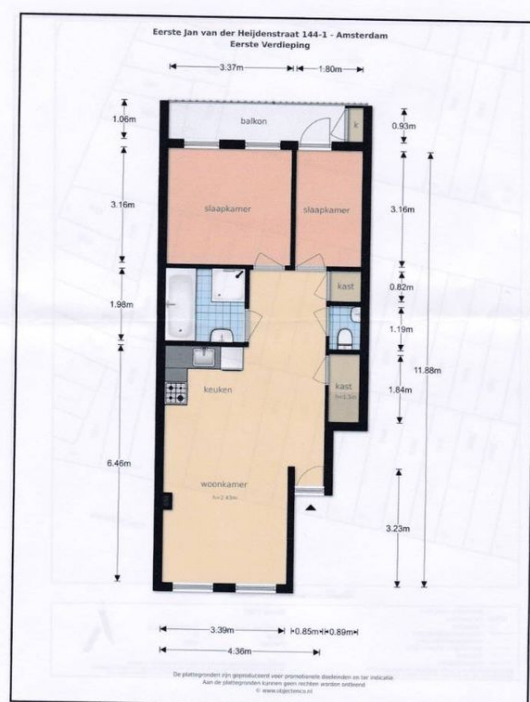
Eerste Jan van der Heijdenstraat 144 I - AMSTERDAM