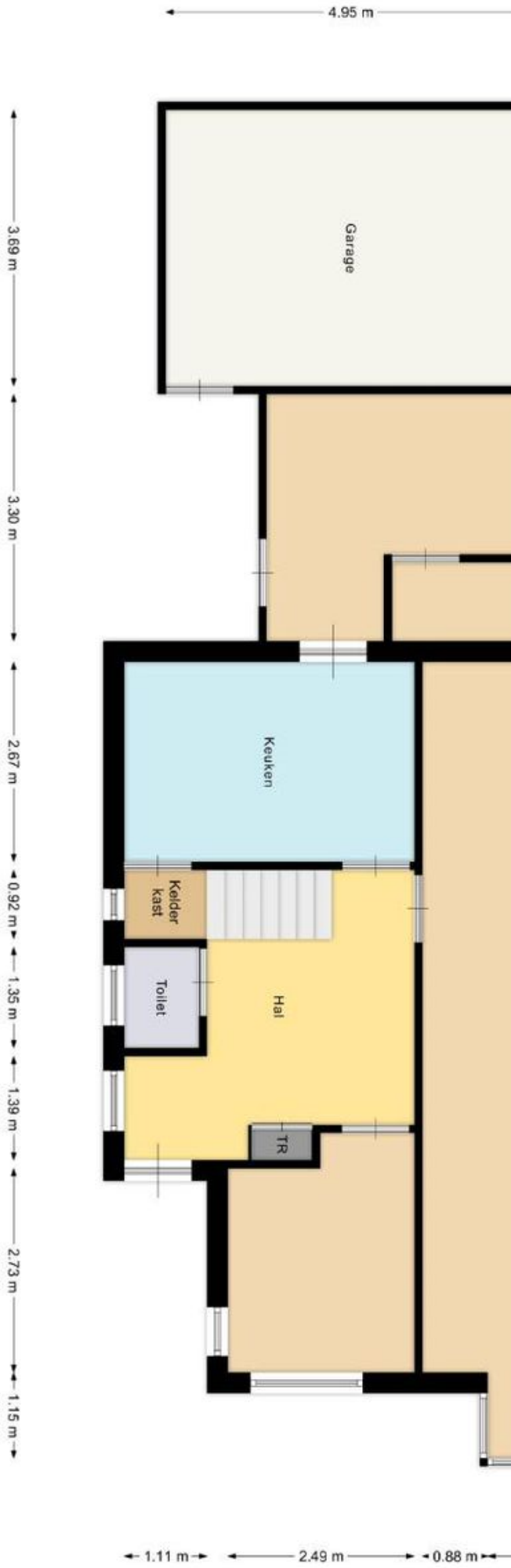
Begane grond Indeling/maatvoering kan afwijken