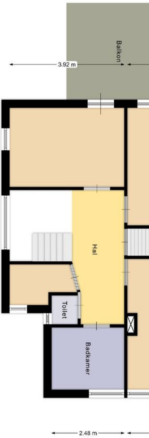
1e verdieping Indeling/maatvoering kan afwijken